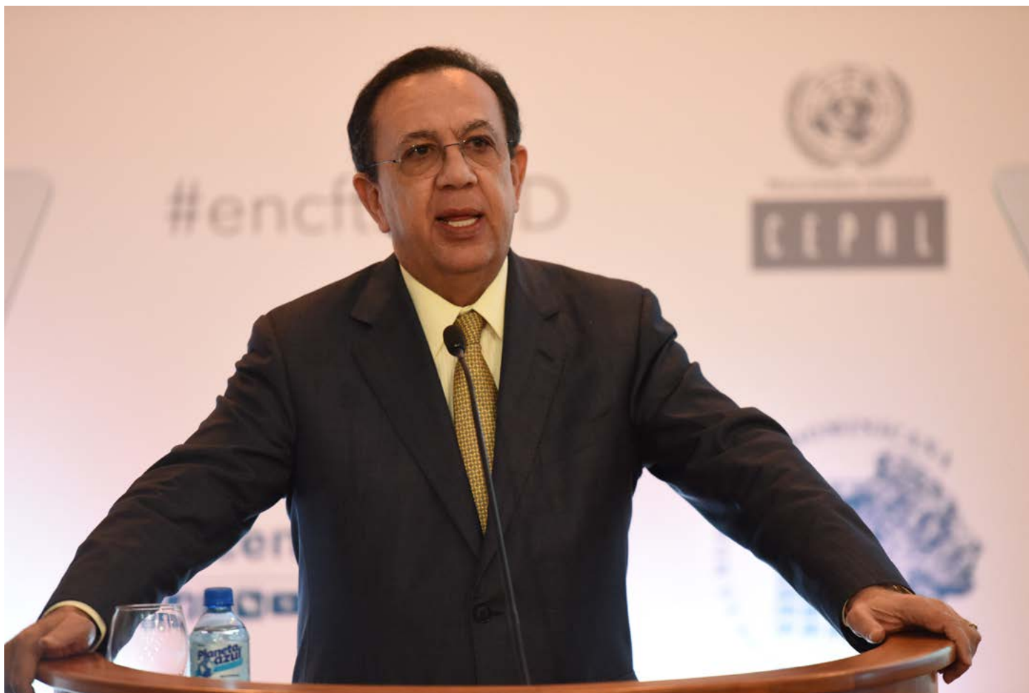
Gobernador Héctor Valdez Albizu

En nombre de las autoridades del Banco Central y del mío propio me complace darles la más cordial bienvenida a este auditorio, en ocasión de la publicación oficial de los resultados de la Encuesta Nacional Continua de Fuerza de Trabajo (ENCFT). Esta nueva encuesta es el resultado de una revisión integral y de la actualización del marco conceptual y metodológico de la Encuesta Nacional de Fuerza de Trabajo (ENFT tradicional), así como la incorporación de las mejores prácticas internacionales mediante la adopción de las últimas disposiciones de la