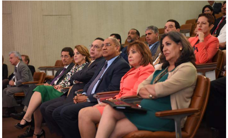
Parte del público asistente

asociados a esta nueva encuesta incluyen indicadores sobre la calidad del empleo y las condiciones laborales, estimaciones del subempleo y la informalidad total, así como las informaciones sobre los ingresos de los hogares que sirven de base para medir la desigualdad y la pobreza monetaria en el país.